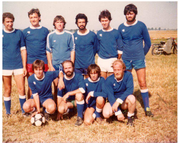
L'équipe de football du village

Les membres du Conseil Municipal, le personnel vous présentent leurs meilleurs vœux pour l'année 2018.